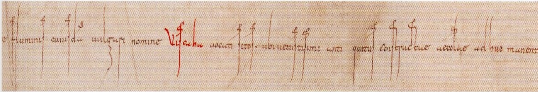
Textausschnitt der Urkunde mit farbig hervorgehobener Erwähnung des Flusses Fischa (grafische Montage).